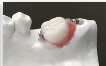
歯牙模型実習：アップライト