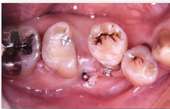
アンカースクリューを使用した下顎小臼歯アップライト症例

実習 動かせる歯牙模型を使用した埋入実習 アンカースクリューを使用し、アップライト・圧下・シンザーズバイトの改善等の歯牙移動テクニックを実践します