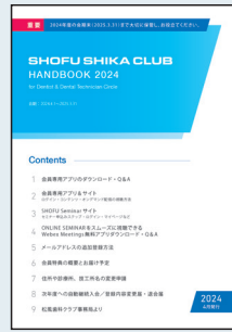
「SHIKA CLUB HANDBOOK」