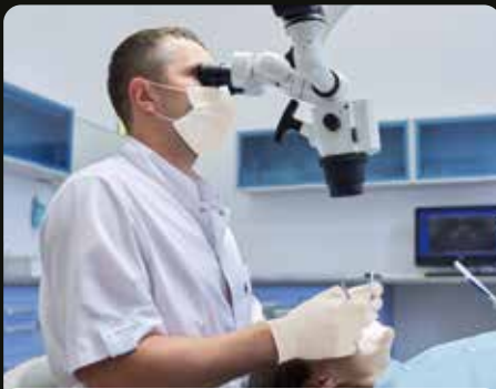
マイクロスコープご使用時にも