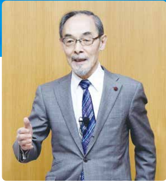
2024年1月の勉強会で講演中